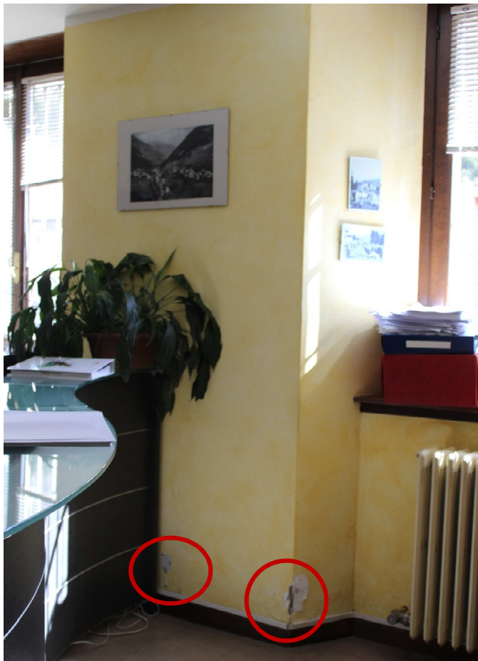
Foto 2 ricezione del pubblico: già all'ingresso sono visibili cadute dello strato pittorico e della preparazione a gesso.

A causa dell'umidità di risalita sono visibili sollevamenti di colore, distacchi dello stesso e dello stato gessoso.