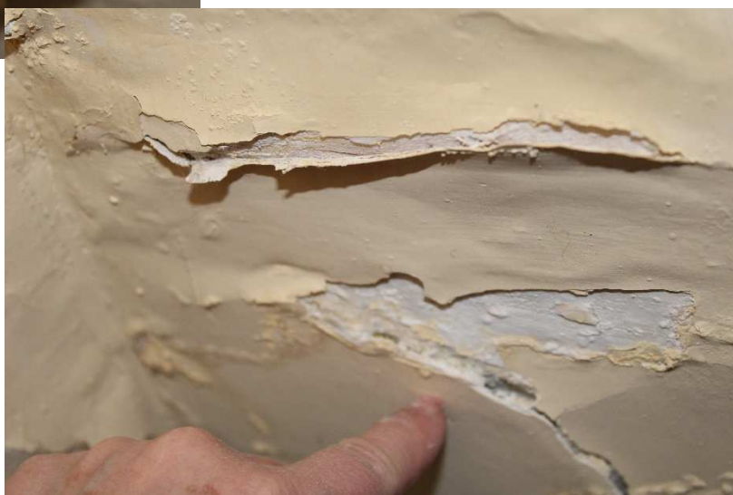
Foto 4-5 Ufficio del Sindaco: particolari dello stato di conservazione, localizzati nella parte bassa della muratura: con sollevamenti delle coloriture, distacchi e cadute di colore

Foto 6-7 Sono visibili più stesure pittoriche stratificate e ormai non adese allo strato sottostante; con una crepa nella muratura