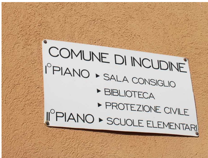
Foto 8 Ingresso piano superiore con aule didattiche e di servizio per la comunità

Piani superiori , precedentemente in uso alle aule didattiche della ex scuola elementare del paese, a seguito della sua chiusura, sono state adibite a servizi socioculturali per la comunità.