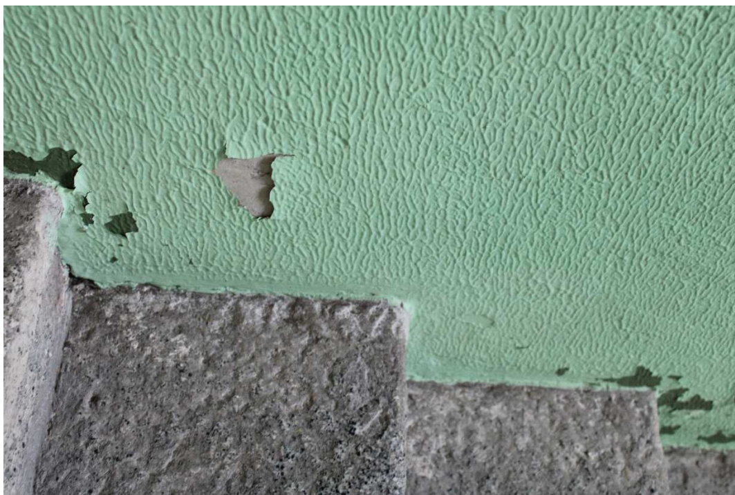
Foto 10-11 Spesso strato di smalto oramai poco adeso