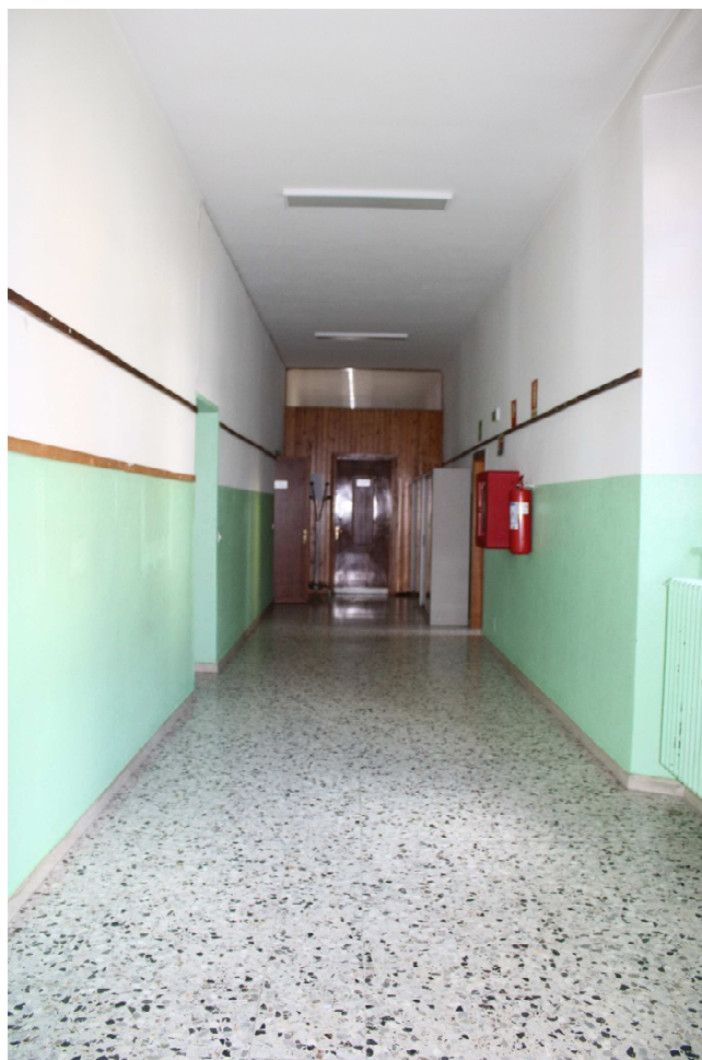
Foto 9 Stato di conservazione corridoio

Proprio a causa del principale utilizzo le stanze sono state generalmente ridipinte con uno spesso strato di smalto lavabile di colore verde.