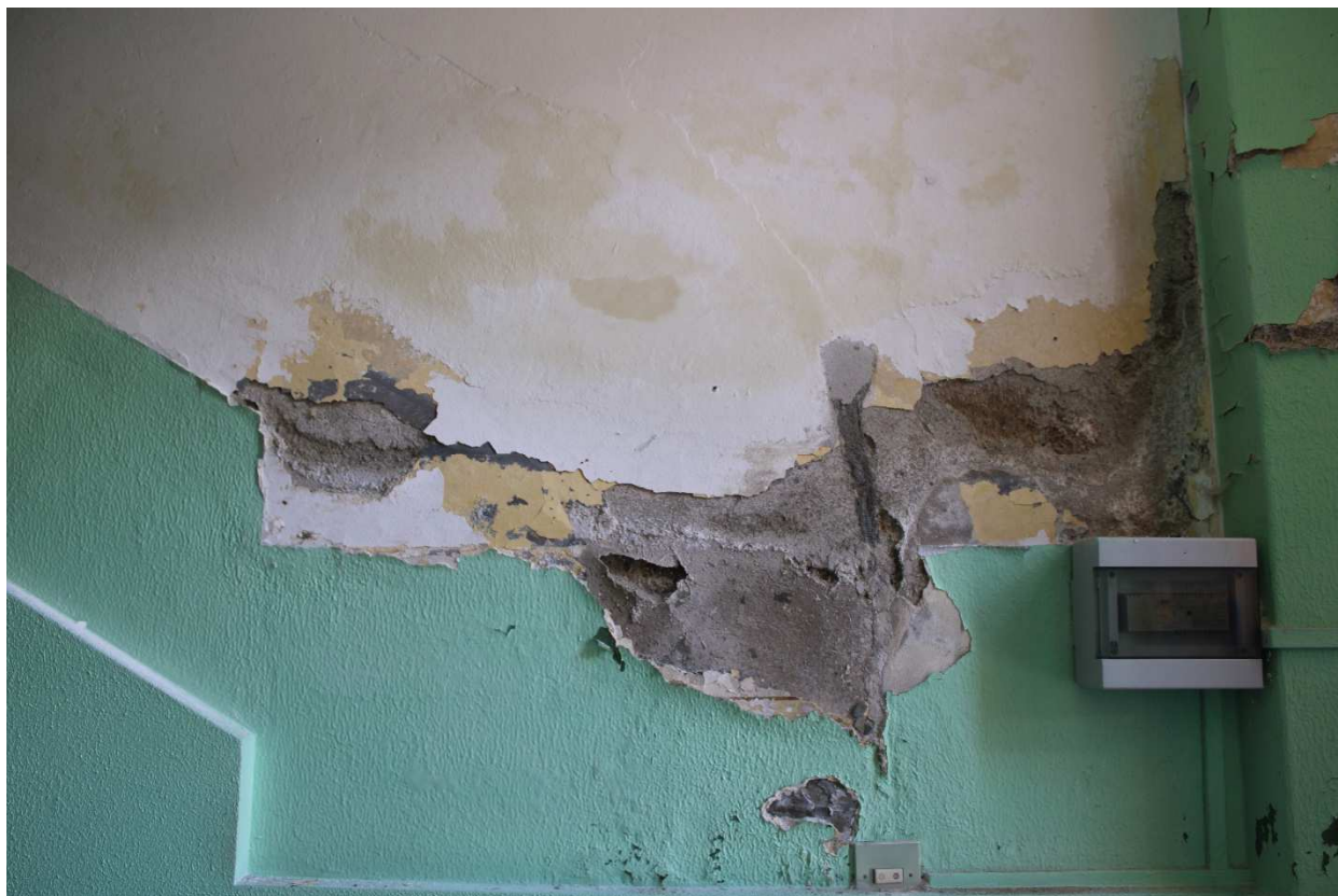
Foto 13-14 Ingresso ai piani superiori: pessimo stato di conservazione degli intonaci con spanciamiento e caduta degli stessi, sali superficiali, diadesione delle stesure pittoriche