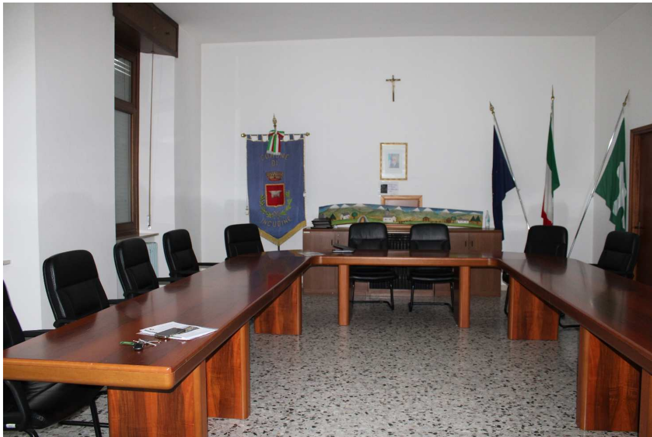
Foto 15 Sala consiliare: stato di conservazione muratura ripristinata

RAPUZZI ROSALBA RESTAURI Via Villa Misericordia, 22 Cell. 335 6192140 28012 CASTELLEONE (CR) Part. IVA 01064170192 Cod. Fisc.: RPZ RL 95H59 D150K